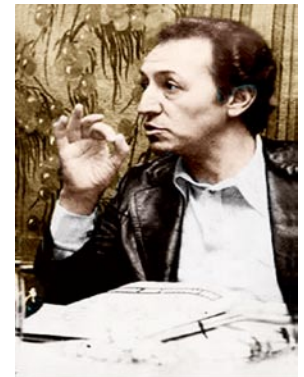
Marcelo Quiroga Santa Cruz

QUIROGA SANTA CRUZ, MARCELO. Nació en Cochabamba en 1931. Político, escritor. Debutó como parlamentario elegido en una fórmula de Falange Socialista Boliviana, época en que se declaraba partidario de las ideas socialcristianas. Fue Ministro de Minas del gobierno burgués de Ovando Candia y firmó el Decreto de nacionalización de las concesiones petrolíferas a la Gulf Oil (1969). Desarrolló labor opositora contra el gobierno de René Barrientos Ortuño. Acusó en el parlamento al general Banzer. Ejerció el periodismo y la cátedra universitaria. Autor de la novela "Los Deshabitados". Premio William Faulkner. Fundador del Partido Socialista, que demandó su incorporación a la Asamblea Popular y formó parte del Frente Revolucionario Antiimperialista de orientación marxleninistatrotskysta. Luego de la escisión de aquel partido timoneó el PS-1, habiendo participado en las elecciones de 1978, 1979 y 1980. Fue asesinado el 17 de julio de 1980, cuando efectivos paramilitares asaltaron el local de la COB y detuvieron a la plana mayor del CONADE, del que formaba parte el PS-1. El CONADE fue un frente nacional dirigido por la burguesía. Su partido lo recuerda infaltablemente con oficios religiosos. En 1985 se escisiona el PS-1 y una fracción interviene en elecciones, sin haber podido preservar intacto su anterior caudal de votos.